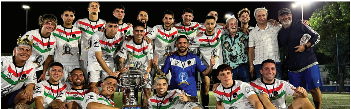
El equipo "Biza FC" festejando su campeonato del "Torneo Apertura Hector Mascheroni".