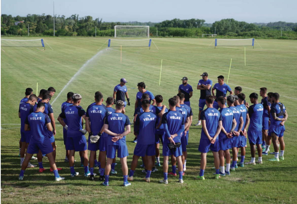
El Plantel de Primera División en su ciclo de Pretemporada en Uruguay.