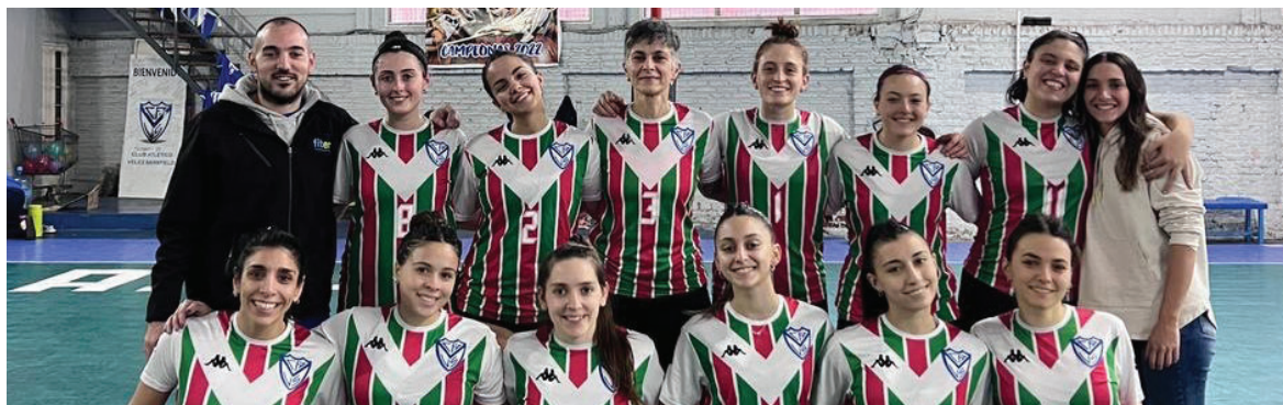
El equipo de Cestoball Femenino.