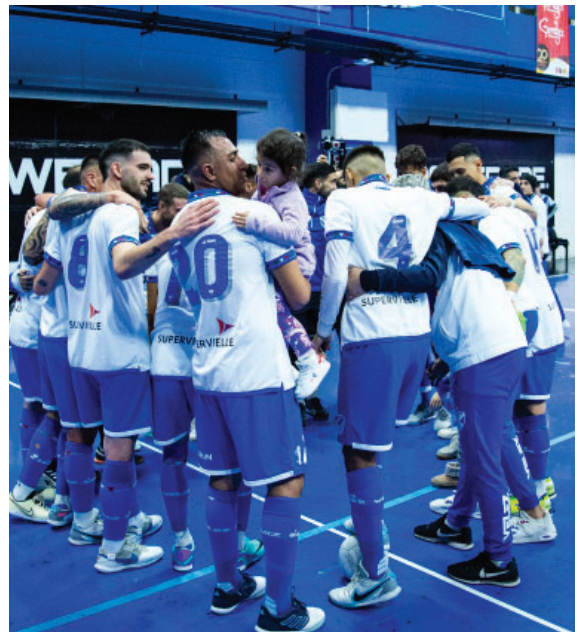
El Futsal de Vélez que no para de crecer.