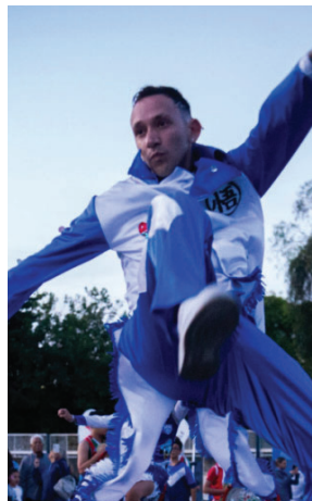
La Murga de Vélez "Fortineros de Corazón".