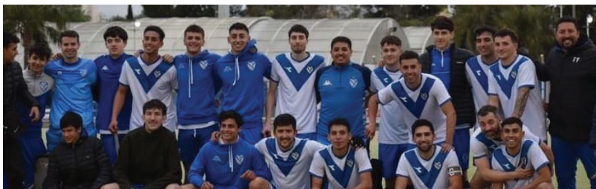
Hockey sobre Césped masculino.