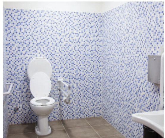
Nueva obra de los baños en el CAS para socios y empleados del sector.