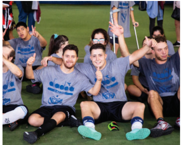
Nuestro equipo de Inclusión festejando su participación en los torneos disputados en el Polideportivo.