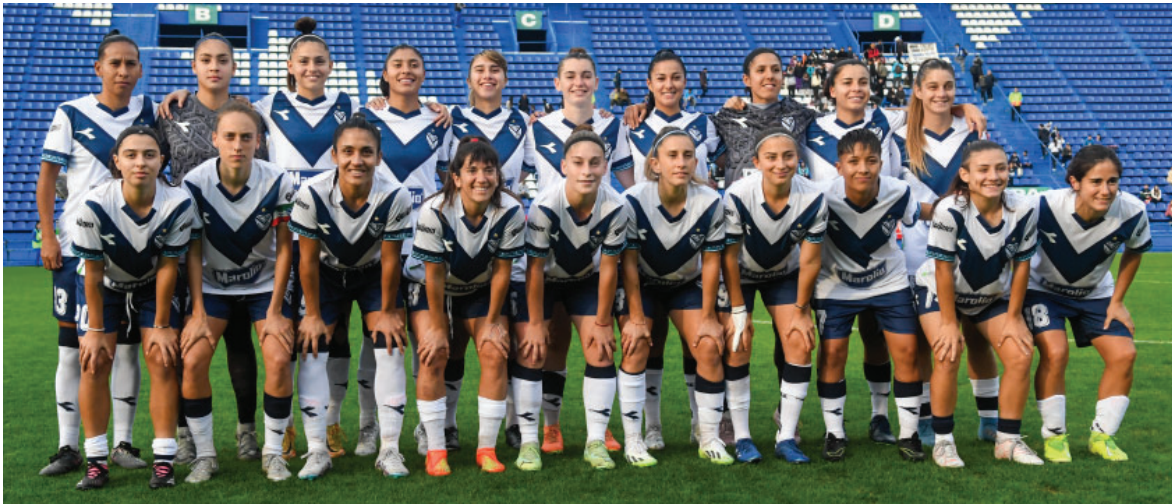
El equipo de Primera División de Fútbol Femenino disputando su encuentro en el Estadio José Amalfitani.