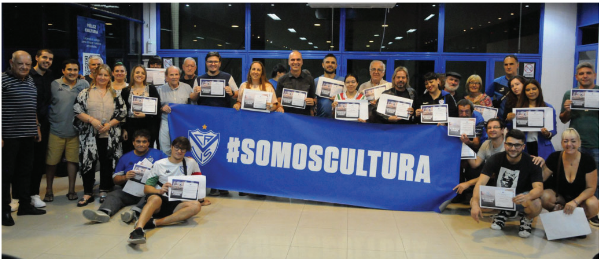
La entrega de diplomas a todos los socios que participaron del "Encuentro literario" organizado por Cultura.