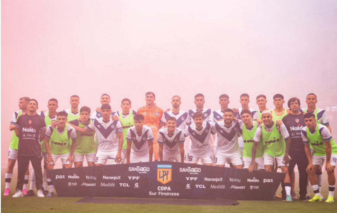
Plantel Profesional en la final de la “Copa de la Liga” disputada en Santiago del Estero.