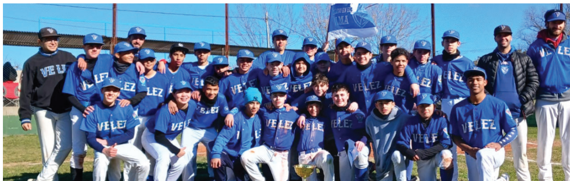
Los chicos del Béisbol velezano.

Ejercicio 114 - Del 1 de julio de 2023 al 30 de junio de 2024