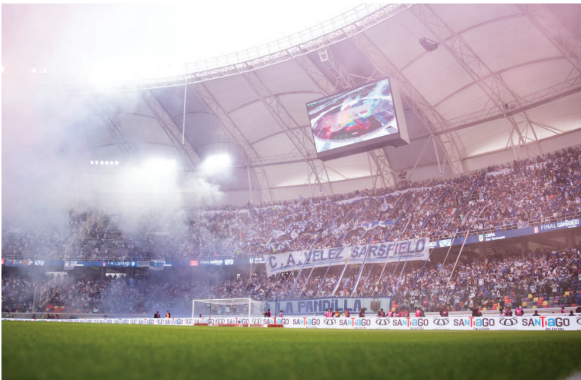
El aliento y acompañamiento de nuestra hinchada en la final de la “Copa de la Liga 2024”.