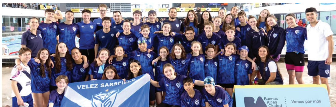
Nuestros nadadores dejando al Fortín en lo más alto.