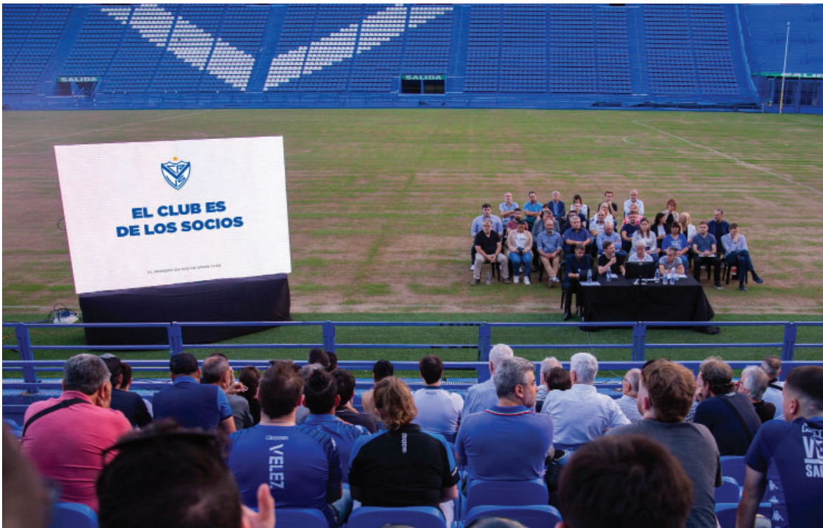
Primera Asamblea informativa de la nueva Gestión a cargo del Club.