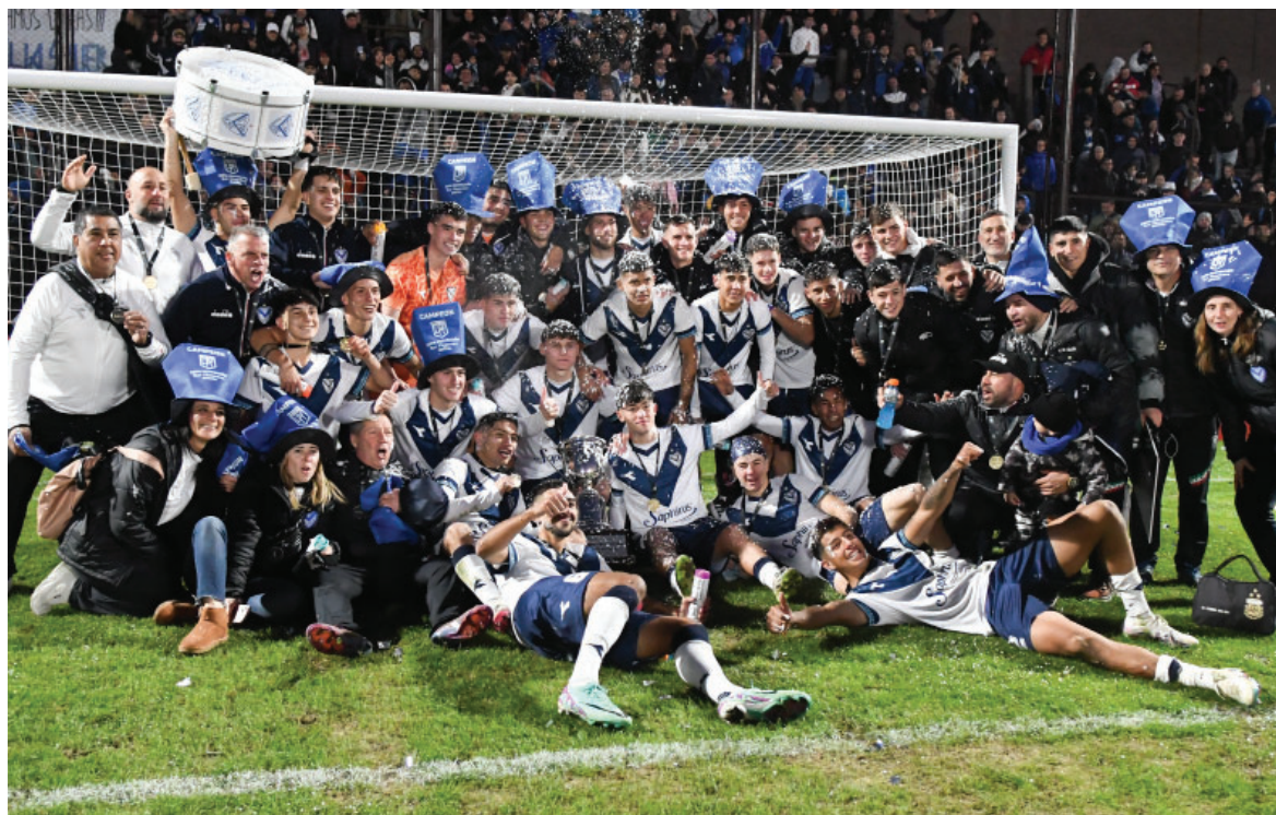
Luego de vencer 5-4 por penales a Lanús en el Estadio Ciudad de Vicente López, la Reserva alzó el título de la Copa Proyección 2024.