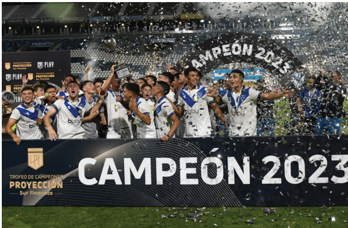
La Reserva cerró un 2023 soñado con la obtención del Trofeo de Campeones, tras vencer 1-0 a Independiente en el Estadio Juan Carmelo Zerillo de La Plata.

Ejercicio 114 - Del 1 de julio de 2023 al 30 de junio de 2024