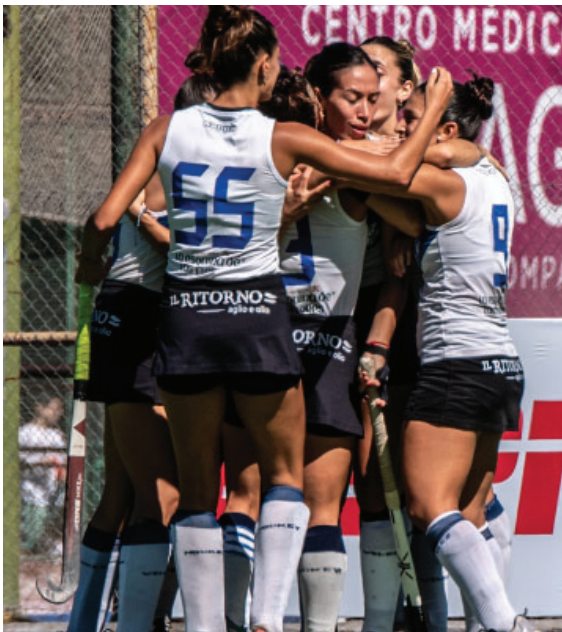
Hockey sobre Césped Femenino.